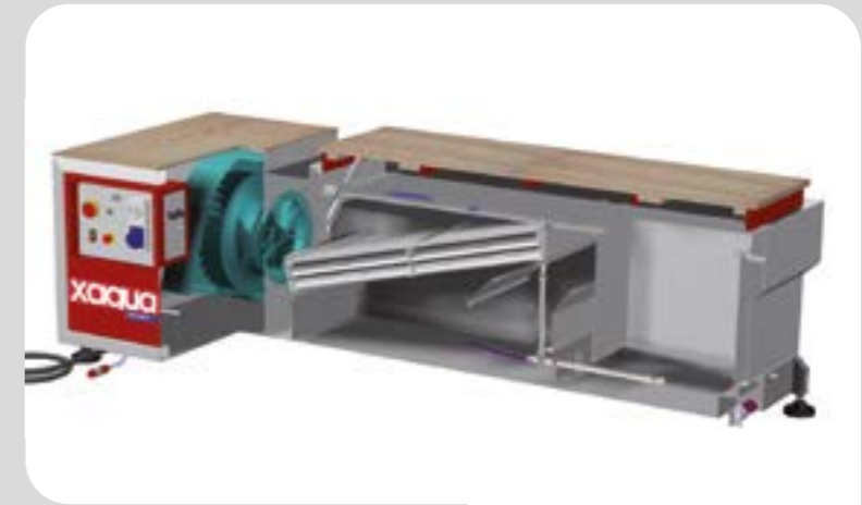
Sezione banco Xagua